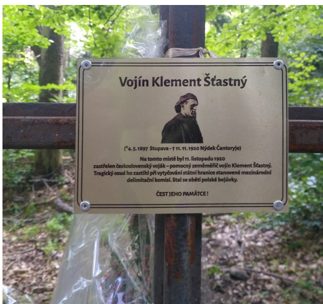
památník vojína Klementa Šťastného na Čantoryji

Vážení účastníci 10. legionářského marše