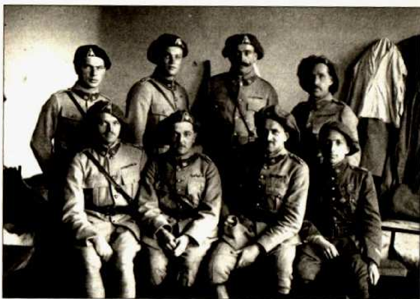
Spolubojovníci po návratu do vlasti.

oni nejsou vycvičeni a vedou válku čistě zákeřnickou. Jsou mezi nimi i 14letí chlapečci, rozeštvaní a velmi zuřivě se bijící.